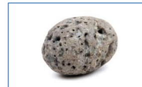
Figure 1. Non potes, nisi retexueris illa.

Insert this footer on pages that do contain proprietary information